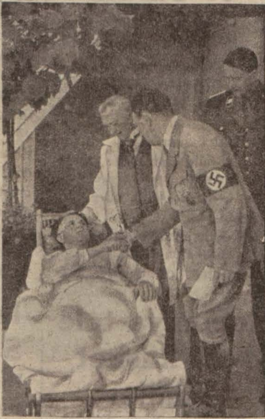
Hitler bir manevrayı takip ediyor bir infilâkta yaralanan ameleyi ziyaret ediyor

Deyli Telgraf gazetesinin Sar havzasına göçtüğü muhabir, Alman ordularının bu mintakayı işgal etmek üzere olduğunu, Enfield de bir hava üssü vücuda getirdiklerini bildirmektedir. Almanyanın Reni tekrar askerî